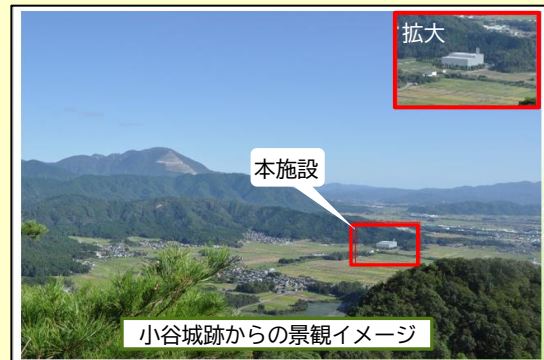
小谷城跡からの景観イメージ