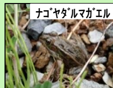
ナゴヤダルマガエル