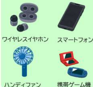
ワイヤレスイヤホン スマートフォン ハンディファン 携帯ゲーム機