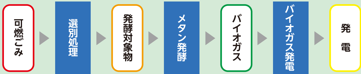
バイオガス化施設の処理フロー