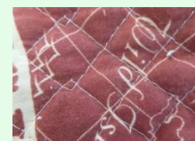
▲キルティング生地

A シーツであっても、キルティング生地のはリサイクルできないため、古布として収集することはできません。1m四方より小さいものは可燃ごみ、大きいものは粗大ごみに出してください。